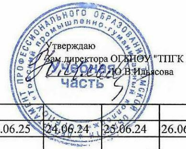
График проведения итоговой государственной аттестации